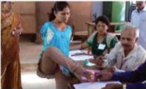
မဲလက်မှတ်တွင် လက်မှတ်ရေးထိုးနေသည့် အမျိုးသမီးတစ်ဦး

အိန္ဒိယနိုင်ငံရှိ မသန်စွမ်းသူများဆိုင်ရာ အဖွဲ့အစည်း တစ်ခုဖြစ်သော မသန်စွမ်းသူအခွင့်အရေးများမဟာမိတ်-တစ်လက်နာဂ (DRA) သည် မသန်စွမ်းသူအမျိုးသားများနှင့် အမျိုးသမီးများအား အခြားသူများကဲ့သို့ တန်းတူညီမျှ ပါဝင်ခွင့်ရရှိရေးအတွက် ဦးဆောင်လှုပ်ရှားခဲ့သည်။ အိန္ဒိယနိုင်ငံရွေးကောက်ပွဲကော်မရှင် (ECI) နှင့် နှစ်ကာလများစွာတိုက်တွန်းဆောင်ရွက်ခဲ့အပြီး မသန်စွမ်းသူများပါဝင်ရေးကို အထောက်အကူဖြစ်စေသော ပြဌာန်းချက်များကို အကောင်အထည်ဖော်လျက်ရှိပါသည်။