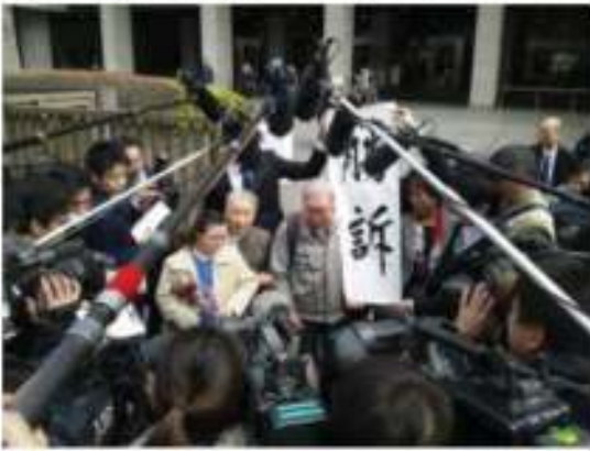
တရားရုံးအပြီး သတင်းစာသမားများကို စကားပြောနေသည့် နာဂိုယာတာကုမိ

တိုက်ရိုက်တရားရုံးသည် ၂၀၁၃ ခုနှစ် မတ်လ ၁၄ ရက်နေ့တွင် အုပ်ထိန်းသူဖြင့်နေရသူများအား ဆန္ဒမဲပေးခွင့်ပိတ်ပင်ထားသည့် ရွေးကောက်ပွဲဥပဒေမှာ ဇွဲ စည်းပုံအခြေခံဥပဒေနှင့် မညီညွတ်ကြောင်း စီရင်ချက်ချခဲ့သည်။ ဤသည်မှာ ယင်းသို့သောဆုံးဖြတ်ချက်ကို တရားရုံးကဆုံးဖြတ်ခဲ့သည်မှာ ဂျပန်နိုင်ငံ၌ ပထမဆုံးဖြစ်သည်။