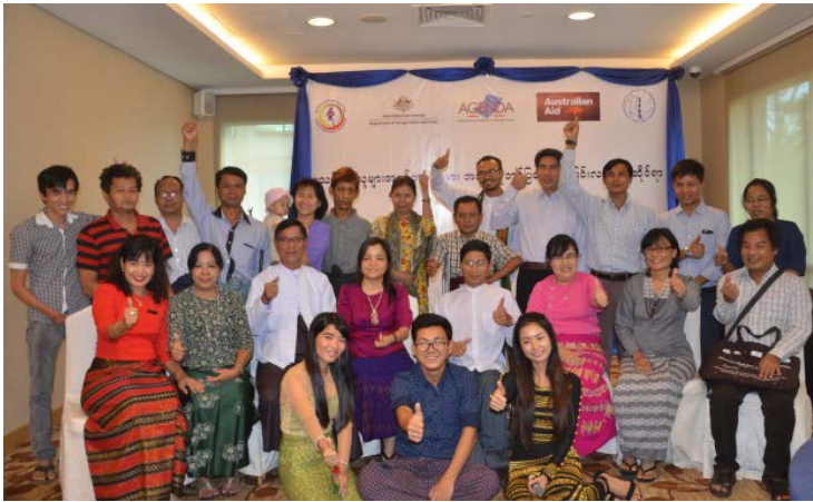
မသန်စွမ်းသူများအကျိုးဝင်အရေးဆို တင်ပြခြင်းဆိုင်ရာ အလုပ်ရုံဆွေးနွေးပွဲ