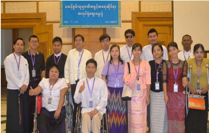
မသန်စွမ်းသူများအခွင့်အရေးဆိုင်ရာ အလုပ်ရုံဆွေးနွေးပွဲ(ပြည်ထောင်စု လွှတ်တော်၊နေပြည်တော်)