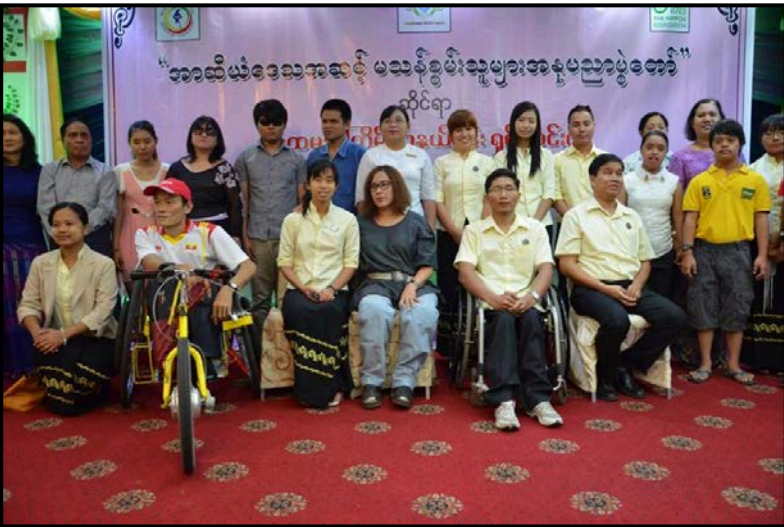
အာဆီယံမသန်စွမ်းသူများအနုပညာပွဲတော် ဆိုင်ရာစာနယ်ဇင်းရှင်းလင်းပွဲ (၂၀၁၄ခုနှစ်)