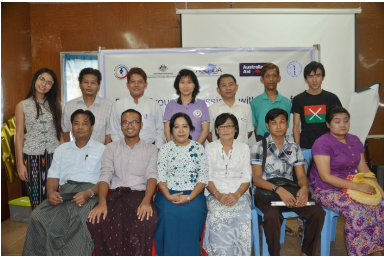
မသန်စွမ်းသူများအကျိုးဝင်အရေးဆို တင်ပြခြင်းဆိုင်ရာ အဖွဲ့ လိုက်ဆွေးနွေးခြင်း (Focus Group Discussion)