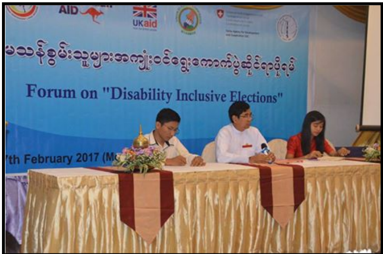
မသန်စွမ်းသူများအကျိုးဝင်ရွေးကောက်ပွဲ ဆိုင်ရာ ဖိုရမ်ကျင်းပခြင်း (၂၀၁၇ခုနှစ်ကြားဖြတ်ရွေးကောက်ပွဲ)