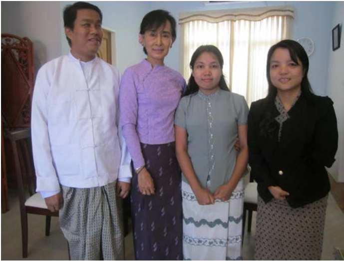
နိုင်ငံတော်၏အတိုင်ပင်ခံပုဂ္ဂိုလ် ဒေါ်အောင်ဆန်းစုကြည်နှင့်တွေ့ဆုံခြင်း