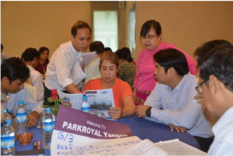
မသန်စွမ်းသူများအကျိုးဝင်အရေးဆိုတင်ပြ ခြင်းဆိုင်ရာ အလုပ်ရုံဆွေးနွေးပွဲ