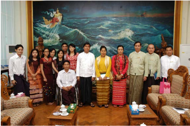
လူမှုဝန်ထမ်းကယ်ဆယ်ရေးနှင့်ပြန်လည် နေရာချထားရေးဝန်ကြီးဌာန ဝန်ကြီး ဒေါက်တာဒေါ် မြတ်မြတ်အုန်းခင်နှင့် တွေ့ဆုံခြင်း