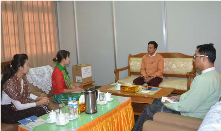
ကယားပြည်နယ်လွှတ်တော်သို့ သွားရောက်၍ အစိုးရသက်တမ်း(၅)နှစ်အတွင်း ဆောင်ရွက် ပေးစေလိုသည့် မသန်စွမ်းသူများ၏ တင်ပြတောင်းဆိုချက် (၁၁) ချက်ပါ စာအုပ် အားမိတ်ဆက်တင်ပြဆွေးနွေးခြင်း