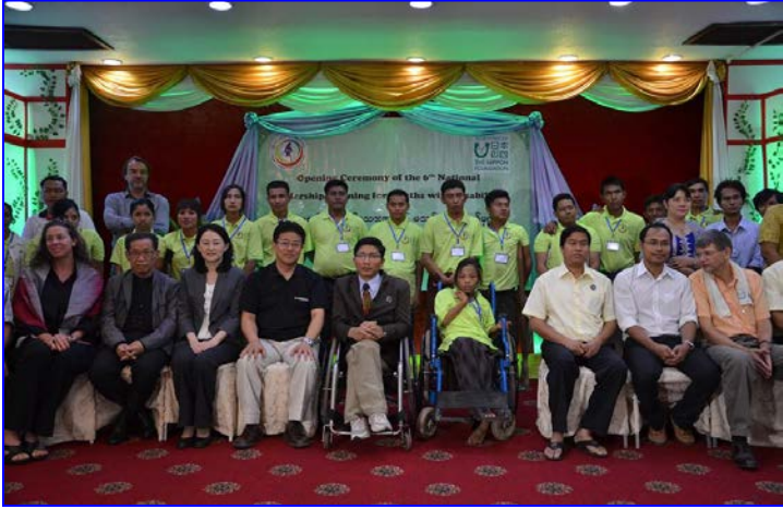
မသန်စွမ်းလူငယ်များခေါင်းဆောင်မှု မြှင့်တင်ရေးသင်တန်း