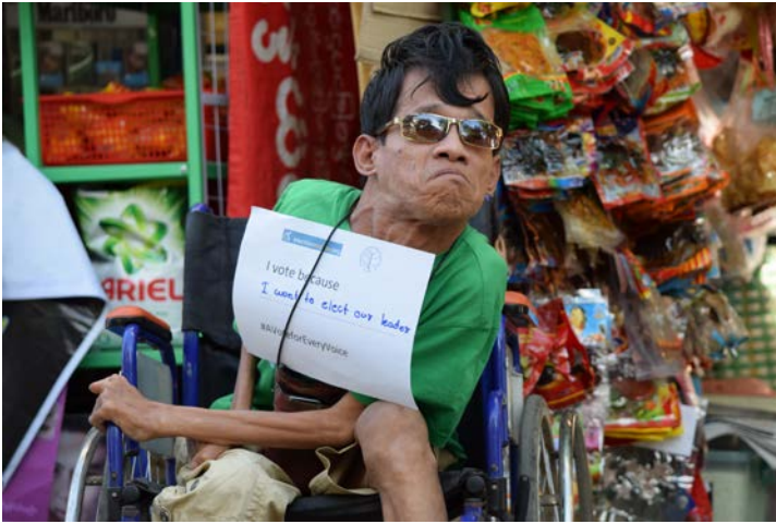
မသန်စွမ်းသူများအကျိုးဝင်ရွေးကောက်ပွဲ ဆိုင်ရာ တွစ်တာ ကမ်ပိန်းပြုလုပ်ခြင်း (၂၀၁၇ခုနှစ်ကြားဖြတ်ရွေးကောက်ပွဲ)