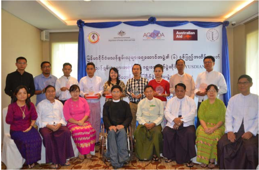
မသန်စွမ်းသူများအကျိုးဝင်ရွေးကောက်ပွဲ ဆိုင်ရာ (YUSDIANA) မီဒီယာဖိတ်ခေါ် ဖြိုင်ပွဲ (သတင်းဆောင်းပါး၊ ဓါတ်ပုံ)