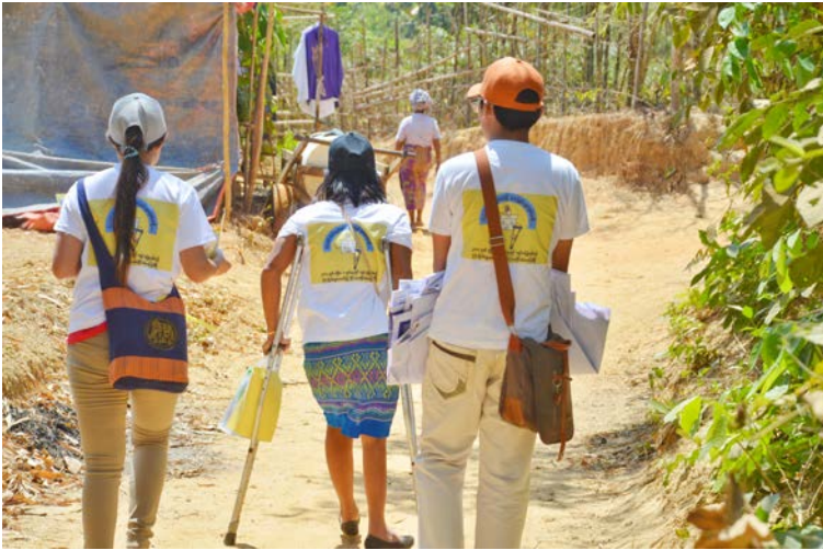
မဲဆန္ဒရှင်အသိပညာပေးပို့စတာနှင့် လက်ကမ်းစာစောင်ဖြန့် ဝေခြင်းဆိုင်ရာ လှုပ်ရှားမှုကမ်ပိန်း